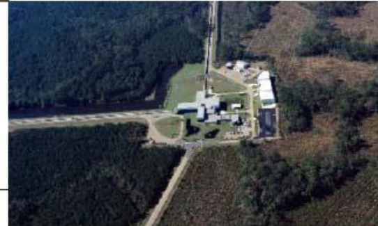
مرصد ليجو - ليفنستون