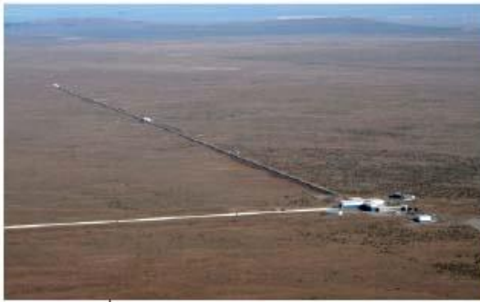
مرصد ليجو - هانفورد